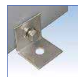
アンカー座 (オプション)