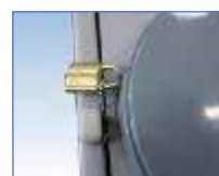
キャップ施錠仕様 (オプション)