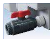
同径ソケット (オプション)