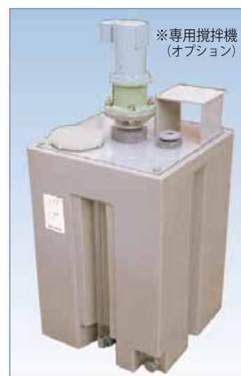
※専用攪拌機 (オプション)