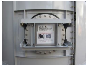
融着式側面マンホール(φ500)