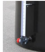
レベルゲージ(オプション)